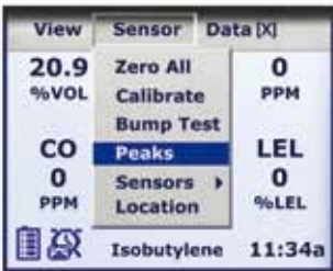
直观菜单使用户能够轻松的操作

MX6 iBrid™是目前世界上选择安装各类传感器最为方便的仪器, 不论是电化学、催化燃烧、红外还是PID传感器都可以同时安装在仪器之上, 为各行各业用户提供最为有效的选择。除此以外, MX6 iBrid™直观式计算机操作菜单和五向导航键使用户可以方便直观地进行仪器的设置和功能选择。支持在线图表来显示即时读数和记录数据。MX6 iBrid™大存储量的数据记录和下载功能为用户提供全面的数据浏览和处理功能。MX6 iBrid™壳体坚固, 享受终身质保, 对于DS2仪器管理平台和iNet™仪器网络完全兼容。