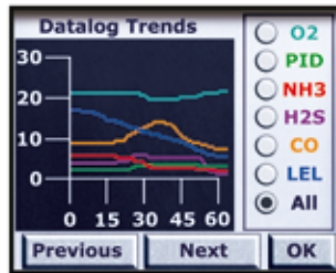
能够以图形的方式查看动态数据日志及直接读数