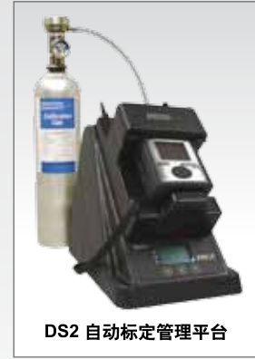
DS2 自动标定管理平台